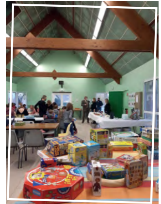
Journée jeux le samedi 13 novembre dernier