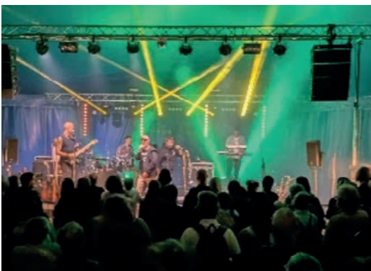
Festival de musiques p. 8