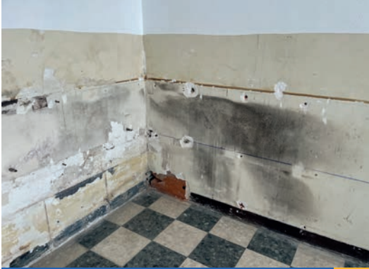
Travaux à la mairie p. 4